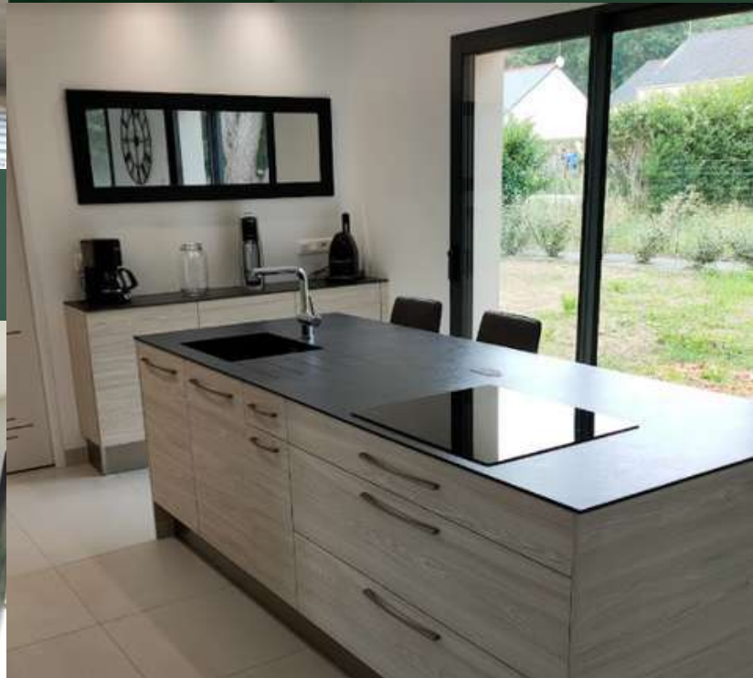
49 RÉALISATION À MAULÉVRIER