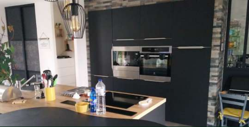
49 RÉALISATION À LA SÉGUINIÈRE