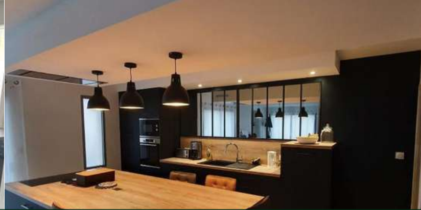
79 RÉALISATION À MAULÉON