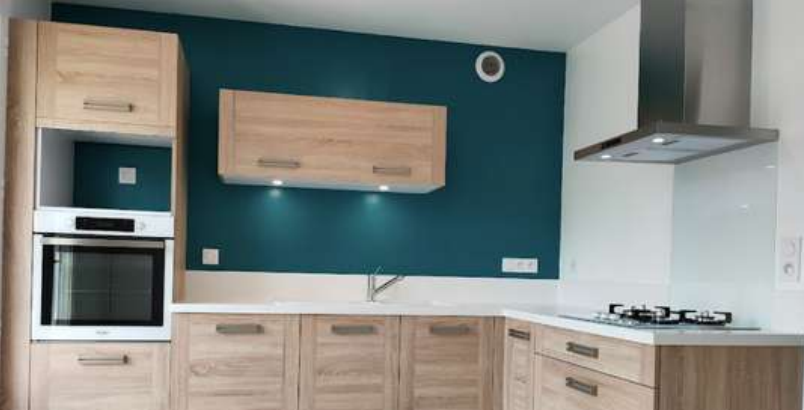
85 RÉALISATION À LA VERRIE