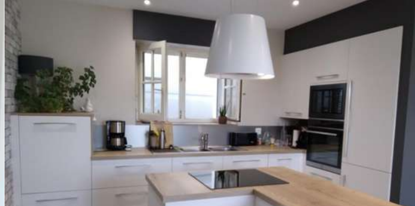
49 RÉALISATION À TRÉMENTINES