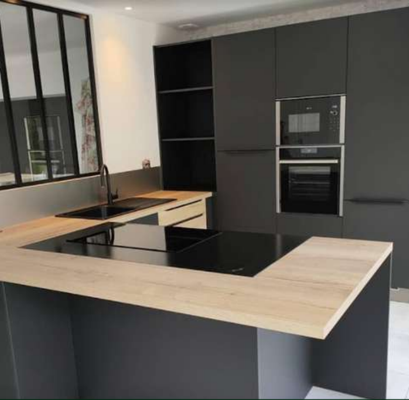
49 RÉALISATION À LA TESSOUALLE