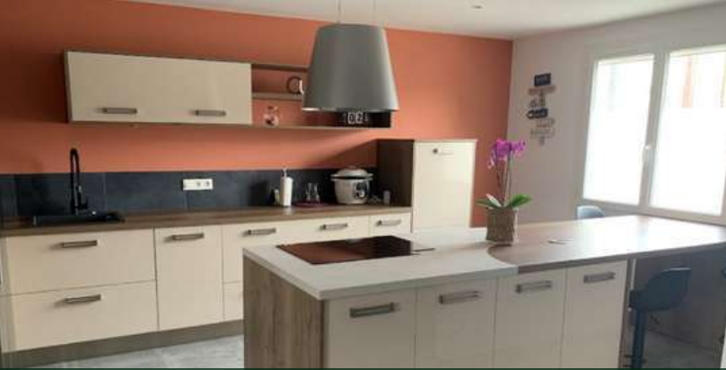
85 RÉALISATION À CHAMBRETAUD