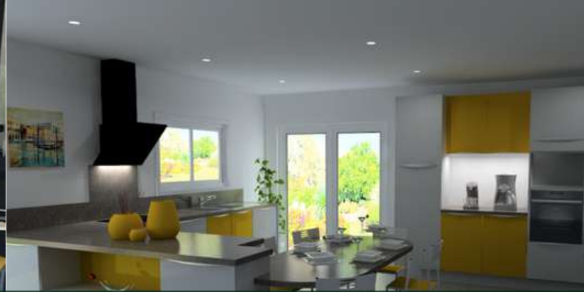
49 RÉALISATION À MAZIÈRES-EN-MAUGES