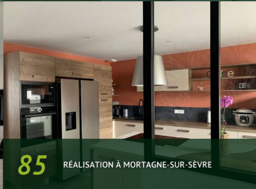
85 RÉALISATION À MORTAGNE-SUR-SÈVRE