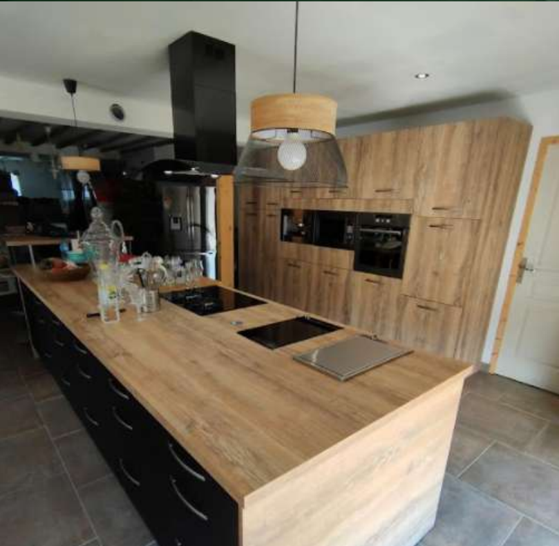
49 RÉALISATION À CHOLET