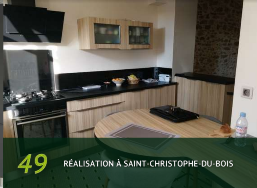
49 RÉALISATION À SAINT-CHRISTOPHE-DU-BOIS