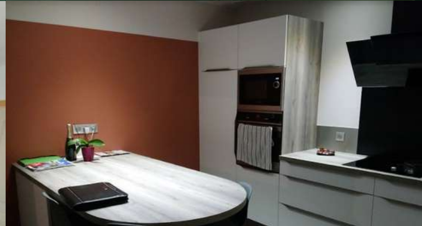
49 RÉALISATION À LES CERQUEUX