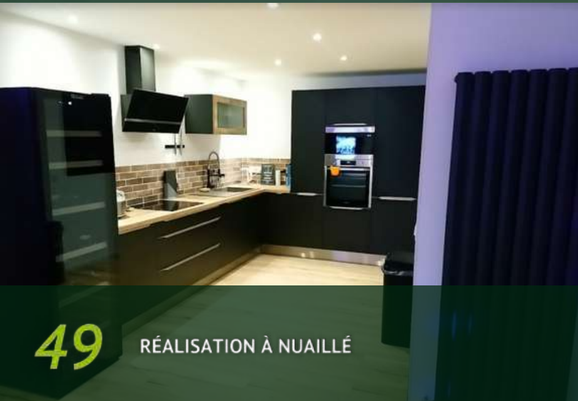
49 RÉALISATION À NUAILLÉ