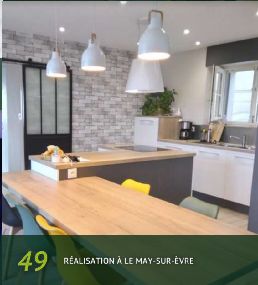
49 RÉALISATION À LE MAY-SUR-ÈVRE