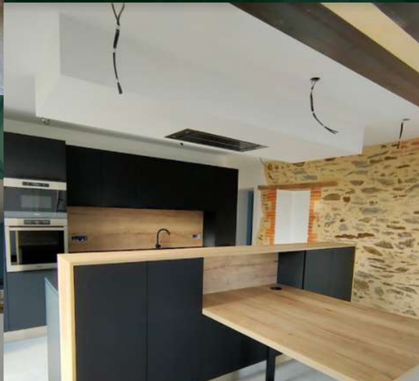
49 RÉALISATION À LA PLAINE