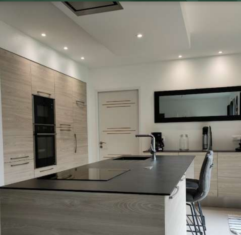
49 RÉALISATION À SÈVREMOINE